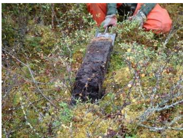
Torvprov i Råsjön