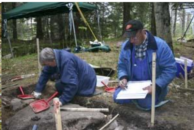
Grävare vid Grannäs