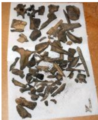
Hushålls- och slaktavfall i Svartviken